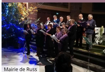
Mairie de Russ