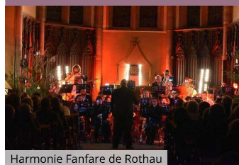
Harmonie Fanfare de Rothau