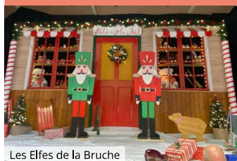
Les Elfes de la Bruche