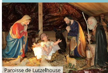
Paroisse de Lutzelhouse