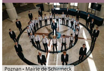
Poznan - Mairie de Schirmeck