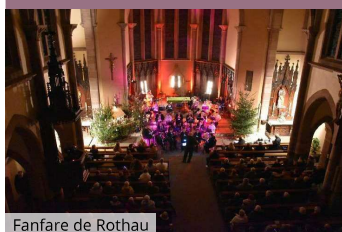
Fanfare de Rothau