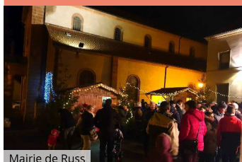
Mairie de Russ