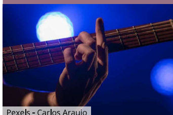
Pexels - Carlos Araujo