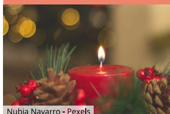
Nubia Navarro - Pexels

6 rue du Château 67570 Rothau ☎ +33 3 88 97 02 12 ✉ rothau-mairie@wanadoo.fr