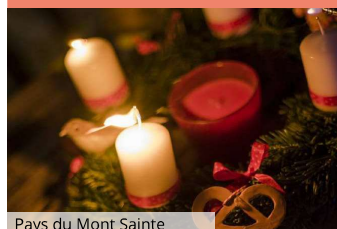
Pays du Mont Sainte

Place des Sports 67130 Wisches ✉ akeh67130@gmail.com