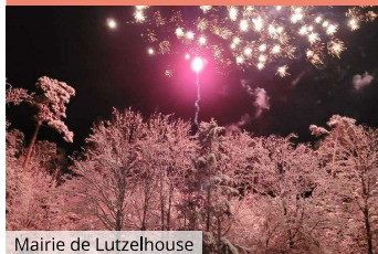
Mairie de Lutzelhouse

3 rue de la Gare 67130 Lutzelhouse ☎ +33 3 88 97 40 24 ✉ info@mairie-lutzelhouse.fr 💻 lutzelhouse.fr