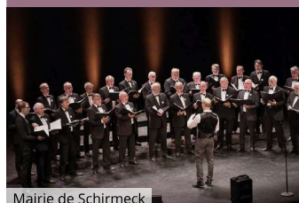
Mairie de Schirmeck