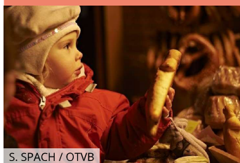
S. SPACH / OTVB